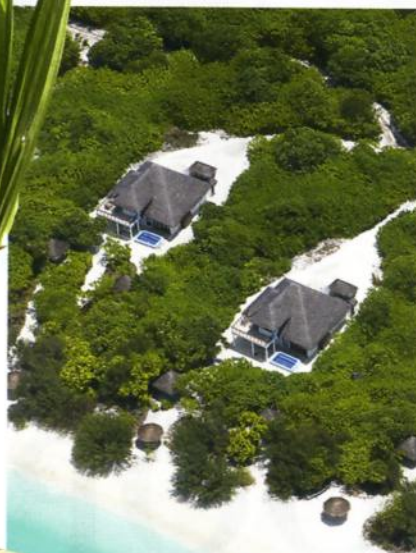
PRIVACY! So viel Platz hat man im eco-friendly „Island Hideaway“